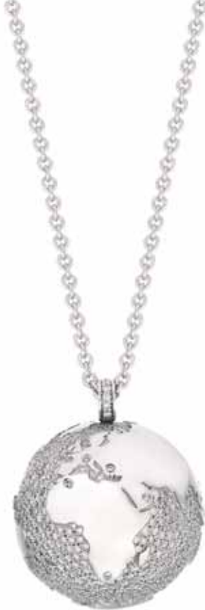
Weltkugel Pavé Meer | 28.700 € 840 Brillanten gesamt 4,0 ct | Weißgold