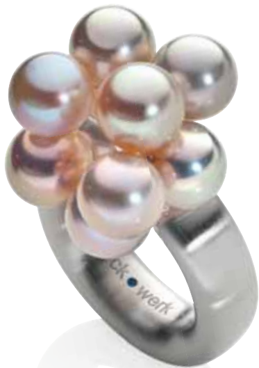
Ring | 1.290 € 10 Roséperlen | Edelstahl