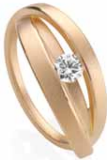
Ring | 2.990 € 1 Brillant 0,25 ct | Rotgold