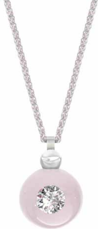
Collier | Preis auf Anfrage 1 Brillant 1,25 ct | Kette mit Rositkugeln | Weißgold