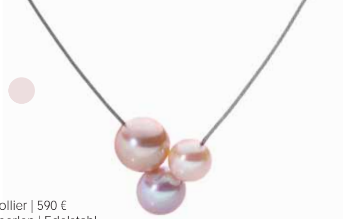
Collier | 590 € 3 Roséperlen | Edelstahl