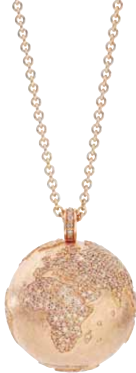
Weltkugel Pavé Kontinente | 13.900 € 470 champagnerfarbene Brillanten gesamt 2,0 ct | Rotgold