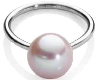
Ring | 390 € 1 Roséperle | Edelstahl