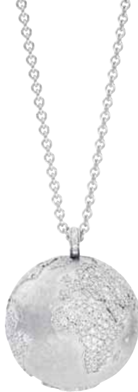
Weltkugel Pavé Kontinente | 16.800 € 470 Brillanten gesamt 2,0 ct | Weißgold