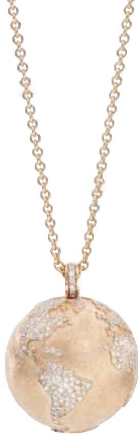
Weltkugel Pavé Kontinente | 15.900 € 470 Brillanten gesamt 2,0 ct | Gelbgold