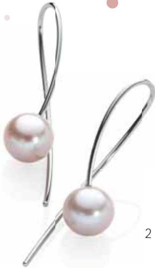
Ohrhänger | 390 € 2 Roséperlen | Edelstahl