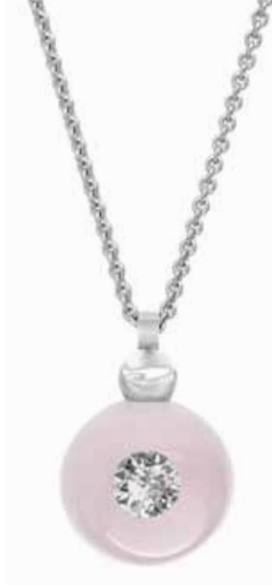
Collier | 3.350 € 1 Brillant 0,25 ct | Weißgold