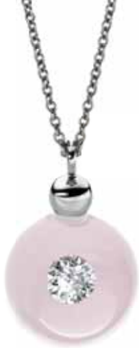
Collier | 1.890 € 1 Brillant 0,25 ct | Edelstahl