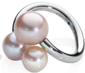
Ring | 1.090 € 3 Roséperlen | Edelstahl