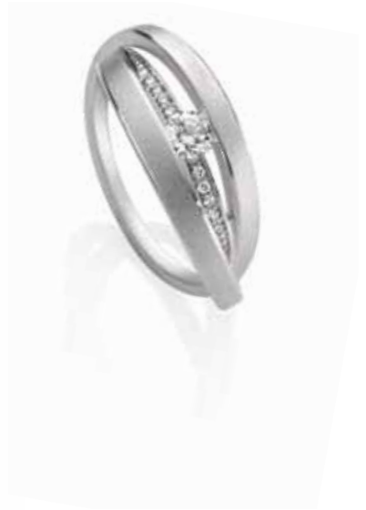
Ring | 3.490 € 1 Brillant 0,25 ct | 10 Brillanten gesamt 0,06 ct | Weißgold