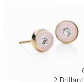
Ohrstecker | 1.790 € 2 Brillanten gesamt 0,08 ct | Rotgold